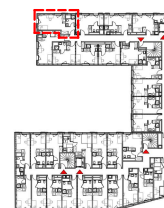
Plan de repérage / niveau 2